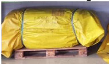
Figuur 1 Pakket